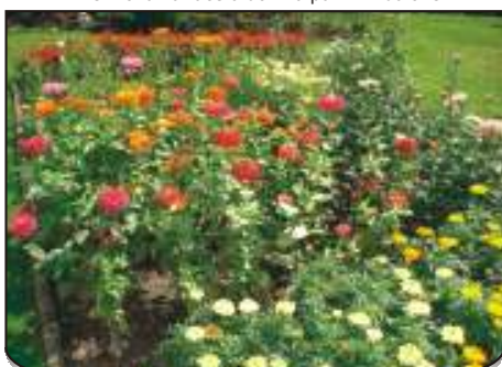
Sympatický letní květinový záhon Gusty Dudové