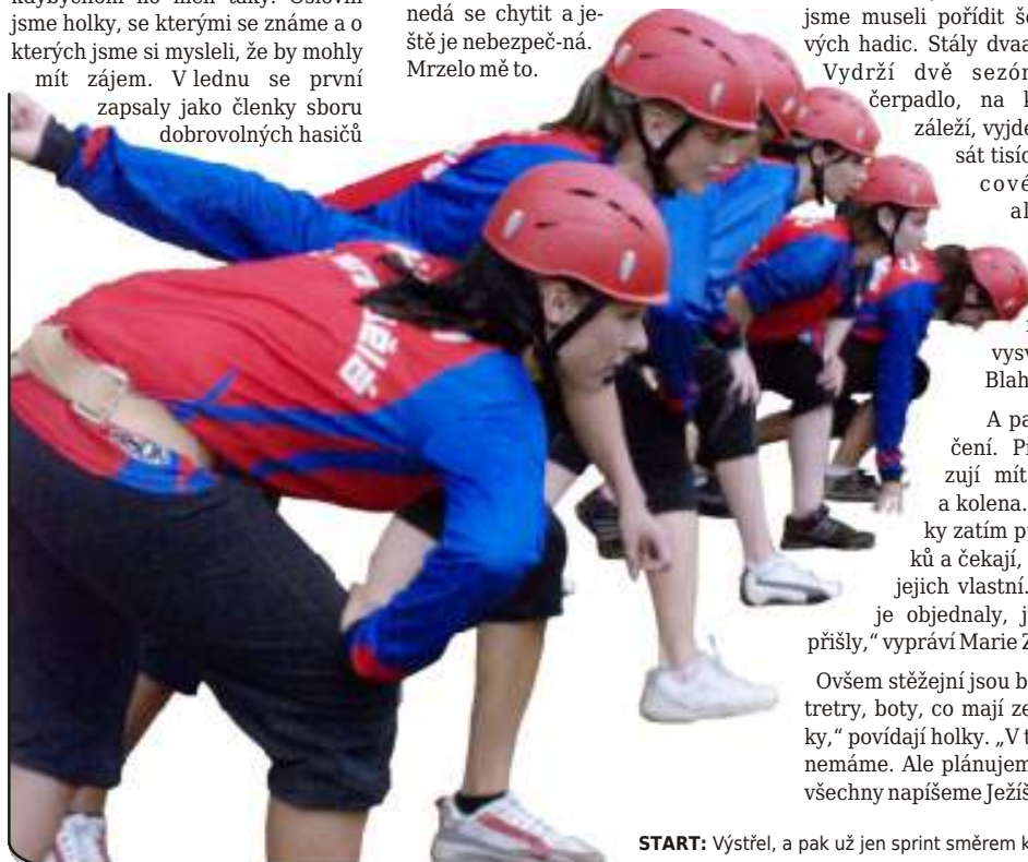
START: Výstřel, a pak už jen sprint směrem k terči.