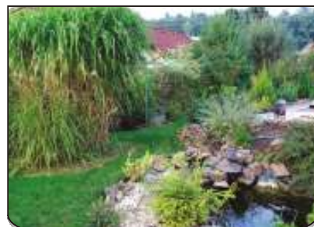
Pohled mezi zeleň Dáši Sýkorové