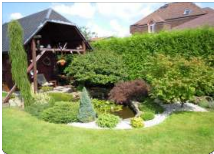
Zákoutí s domkem a jezírkem je nejoblíbenější.