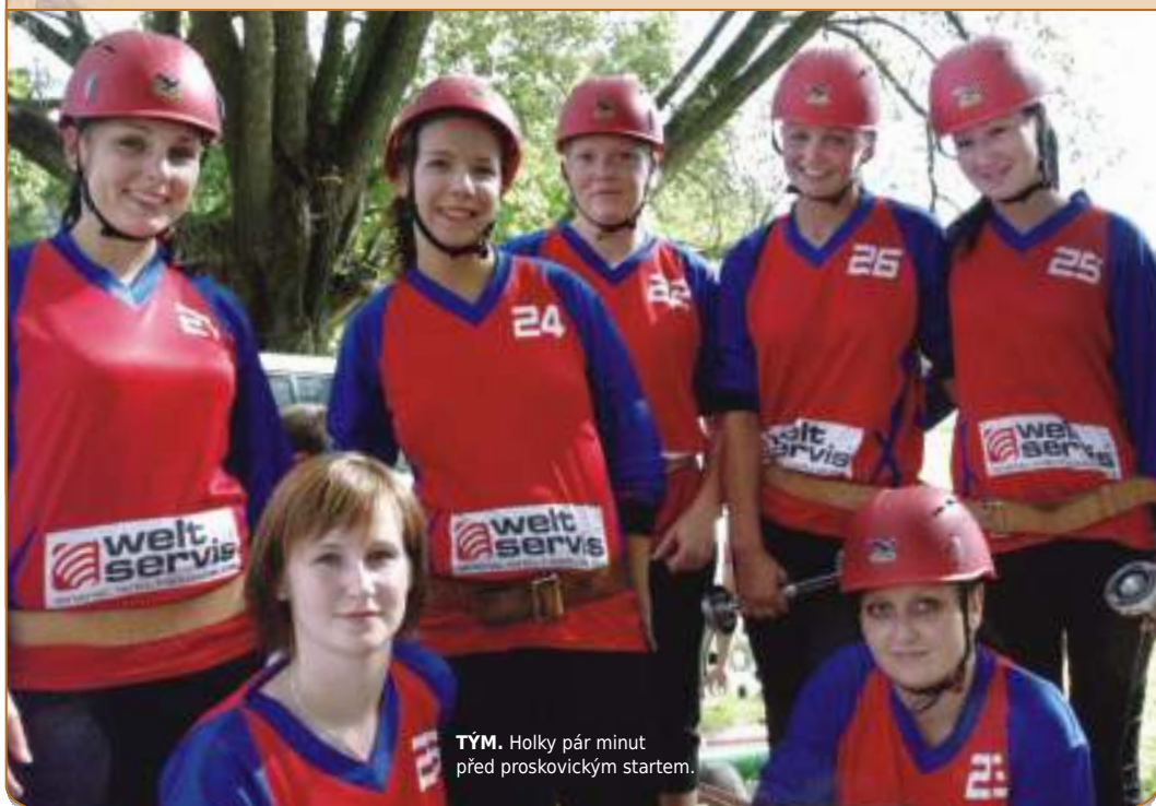
TÝM. Holky pár minut před proskovickým startem.