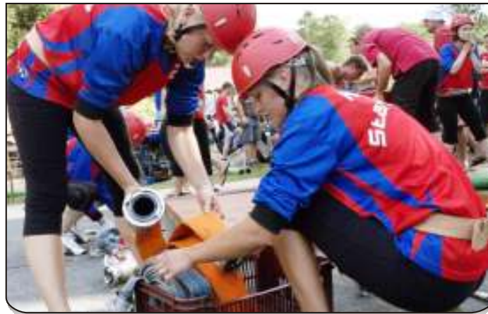
ZÁKLADNA. Každý předmět má své přesně dané místo.

Ale přišly i lepší okamžiky. „V Orlové a v Proskovicích se nám povedlo zaběhnout druhé místo,“ vyzdvihují holky největší úspěchy první sezony.