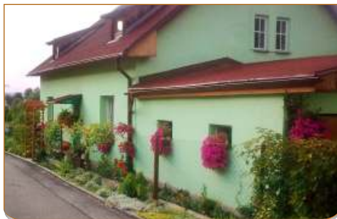
Zdeněk Kološ vsadil na barvy. A dobře udělal.