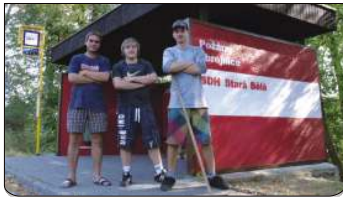
Starobělsští hasiči si vzali zastávku u zbrojnice do parády.

On i jeho kolegové teď ze své základny odnaproti pozorují, jak na novou vizáž budky reagují cestující. Prý zatím zaskočeně a nesměle. „Postávají okolo a někteří se stydí sednout si dovnitř,“ říkají hasiči s úsměvem.