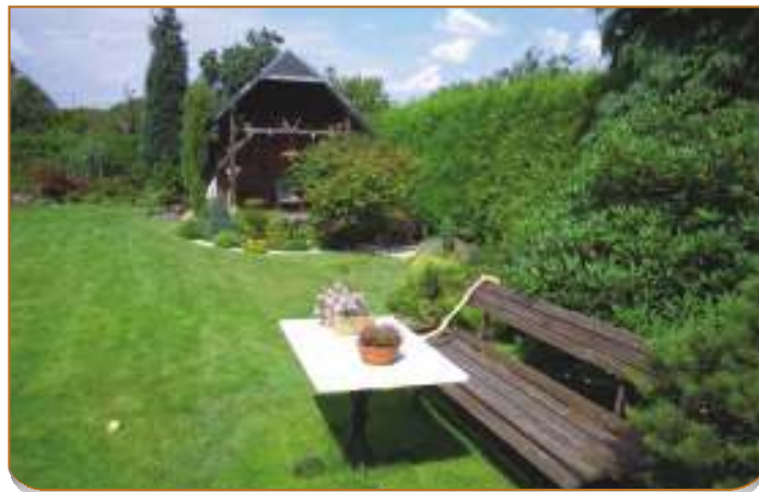
Úhledná zahrada Antonína Polcera zve k posezení