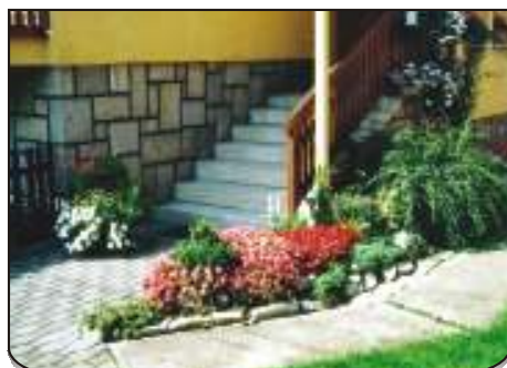
Manželům Havlínovým to okolo domu voní a kvete