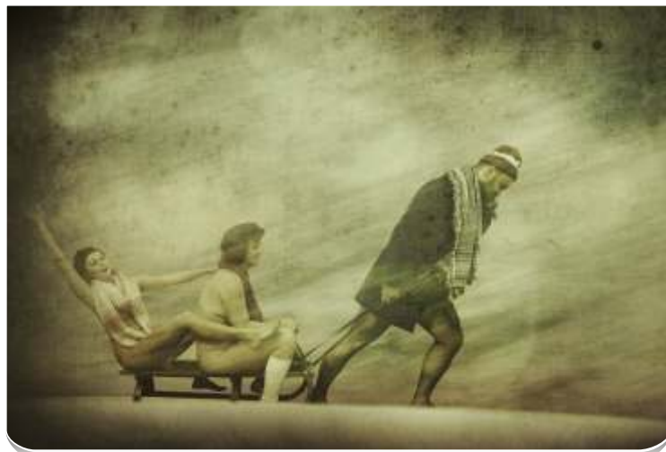
Když jsem potkal Yettiho. Fotografie patří do kalendáře, který zatím nevznikl.