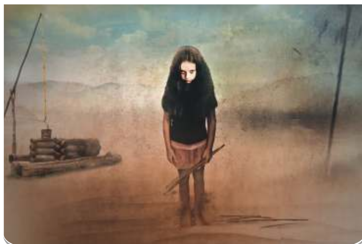
Dcera náčelníka při sběru dříví. Jedna z nejnovějších fotografií.