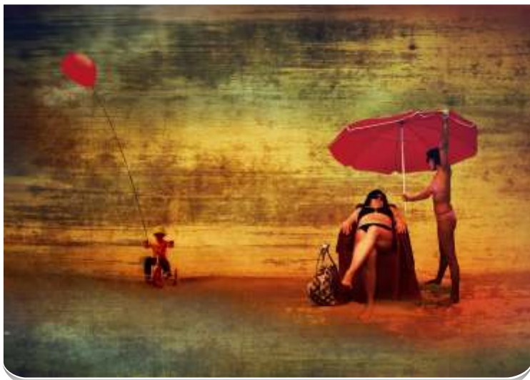
Když na pláži balónek. Drží jej fotografův mladší syn Filip.