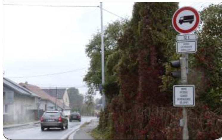
Omezení udělalo radost především lidem, kteří bydlí na Mitrovické ulici. Ale nejen jim.

A firma na to nebude potřebovat ani tolik času. „Vše má skončit do 15. listopadu,“ dodává ještě. (joh)