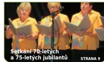
Setkání 70-letých a 75-letých jubilatů