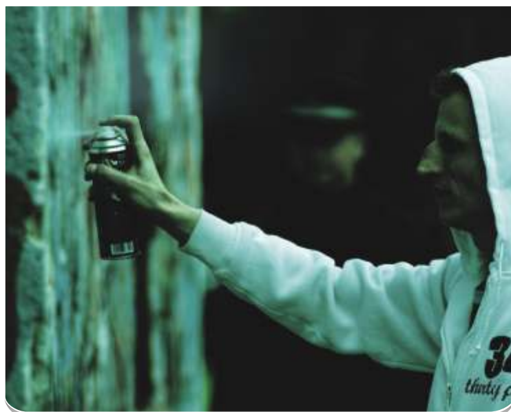
Když ptáčka lapají. Autor fotil před rokem na Dubině.