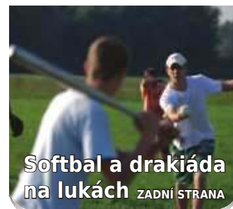
Softbal a drakiáda na lukách ZADNÍ STRANA

OHLASY OBECNÉ A OBECNÍ • ČÍSLO 10 • ŘÍJEN 2010 • ZDARMA