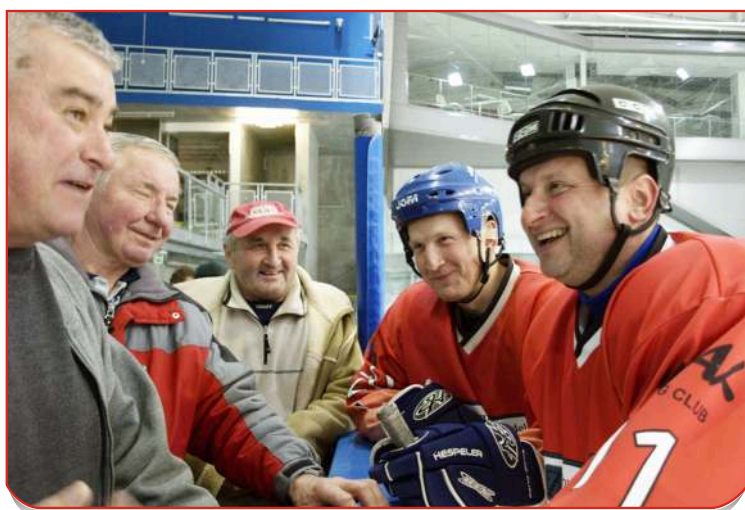
Stará garda chodí na zápasy mladých fandit