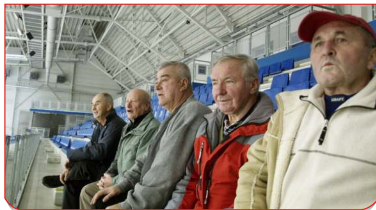
Stará garda drží mladým palce na tribuně

Hajnému je čtyřiašedesát a hokej hraje od čtrnácti. Podobně je na tom jeho kamarád a předseda oddílu hokejistů