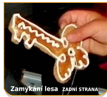
Zamykání lesa ZADNÍ STRANA

OHLASY OBECNĚ A OBECNÍ • ČÍSLO 12 • PROSINEC 2010 • ZDARMA