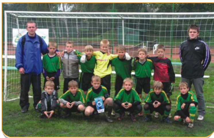
Vítězné družstvo MOSiR Jastrzebie

dobou 2x12 minut. Každé družstvo odehrálo 5 utkání. Na turnaji bylo odehráno celkem 50 utkání. Turnaje se zúčastnilo 130 mladých talentovaných hráčů.