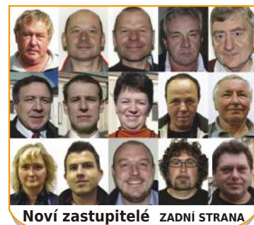
Noví zastupitelé ZADNÍ STRANA

OHLASY OBECNÉ A OBECNÍ • ČÍSLO 11 • LISTOPAD 2010 • ZDARMA