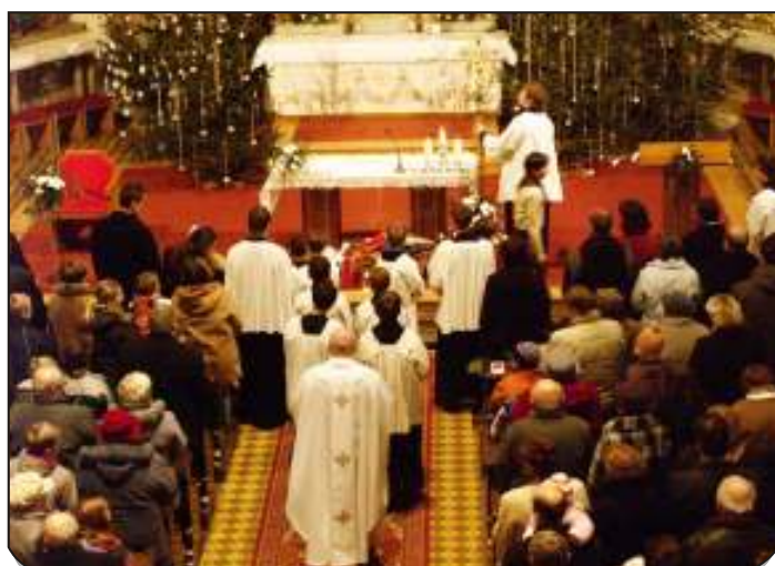
Zahájení vánoční odpolední mše v římskokatolickém kostele.