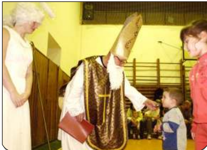
V Sokole se zastavil Mikuláš. Už tradičně i se dvěma anděly a smečkou čertů.