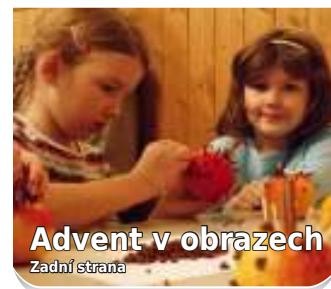
Advent v obrazech Zadní strana

OHLASY OBECNÉ A OBECNÍ • ČÍSLO 1 • LEDEN 2010 • ZDARMA