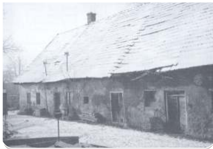
Statek č. 12