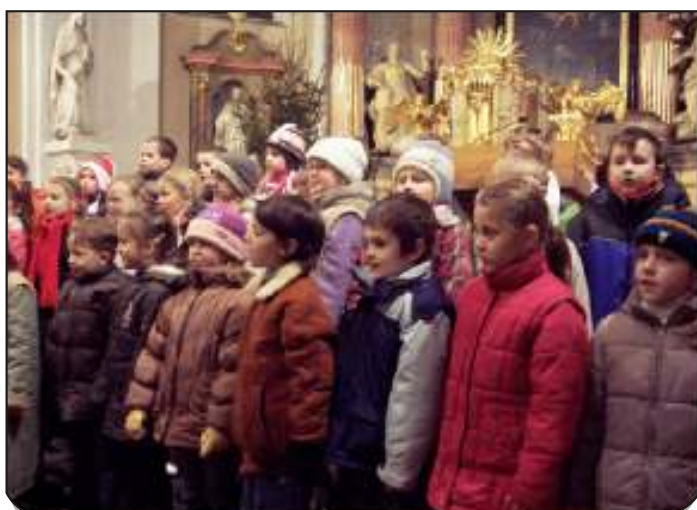
Základní škola uspořádala před Vánoci v kostele koncert.