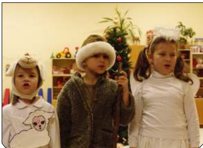
Besídka v mateřské škole. Líbila se dětem i rodičům.