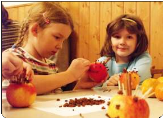
Předvánoční zastavení v Katolickém domě. Děti si zasoutěžily a vyzkoušely zručnost.