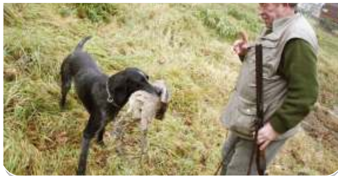
Pes musí přinést kořist rovnou k nohám.

Jeho fenka Gety, která je doprovází, páničkově žádnou úlevu nedopřeje. Jen co vidí po poli pelášit prvního zajíce, trhne - a utrhne se z pevného řemene, který má její pán za pasem. Na volání