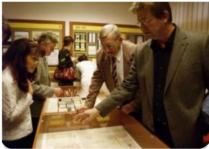
První návštěvníci. Výstavu si můžete prohlédnout v přízemí obecního úřadu

Příprava výstavy ho stála tři měsíce intenzivní práce, včetně objíždění archivů po celém Česku - ve starých záznamech tam hledal zajímavé informace. „Jsem rád, že se o naši poštu zjistily konkrétní údaje. Je to něco, co se zachová i pro další generace,“ věří.