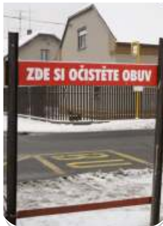
Bahno na botách už nemusíte čistit o lavičku.