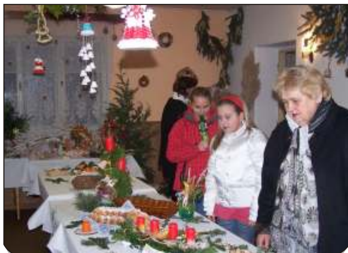
Výstavka u zahrádkářů nabídla vánoční inspiraci.