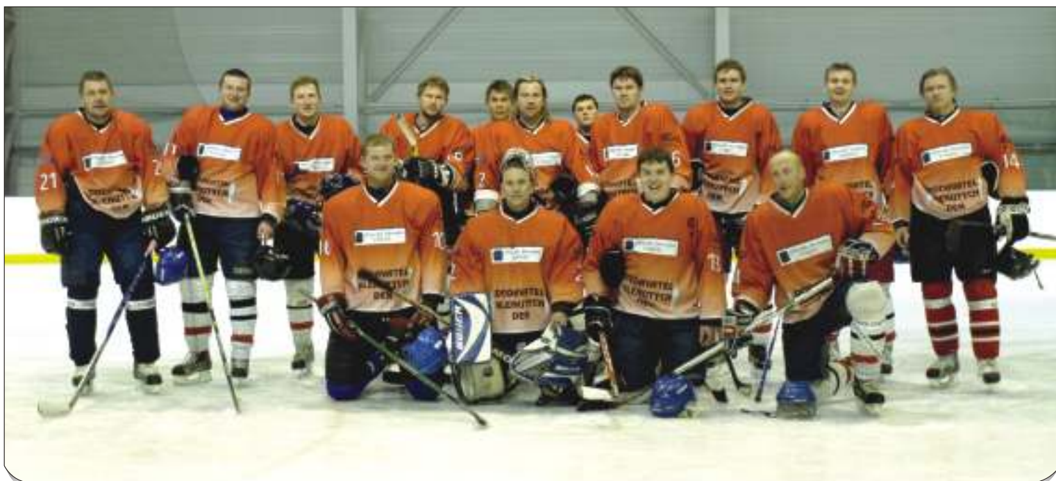
Hokejisté TJ Sokol Stará Bělá před posledním zápasem sezony.