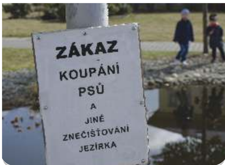
Psí pány usměrňují cedule. Ne všichni je respektují.