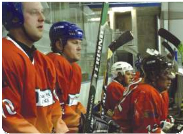
Byly to nervy - i na střídačce.