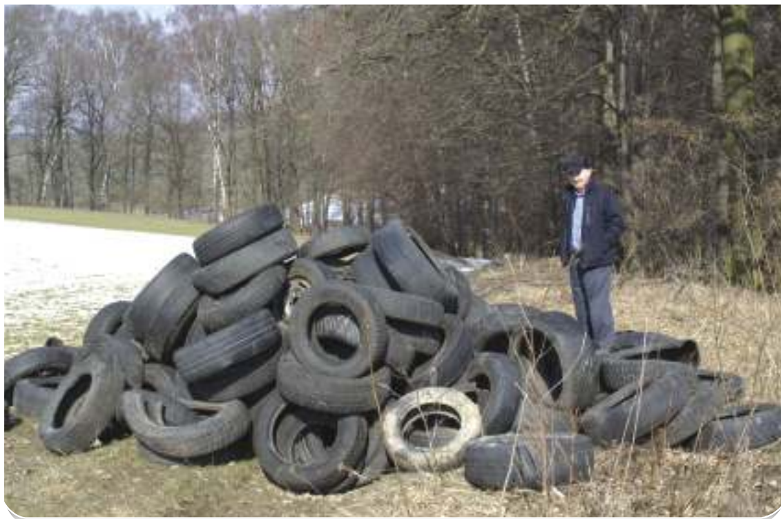
Tajemník Ladislav Dlouhý se nestačil divit. A nebyl sám.

Mnozí lidé podle něj ještě nepostřehli, že volně pobíhající psi nemají v parku co dělat: