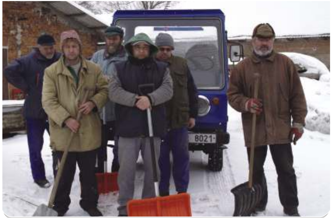
Parta, která se stará o údržbu vesnice, si v zimě neoddychla.