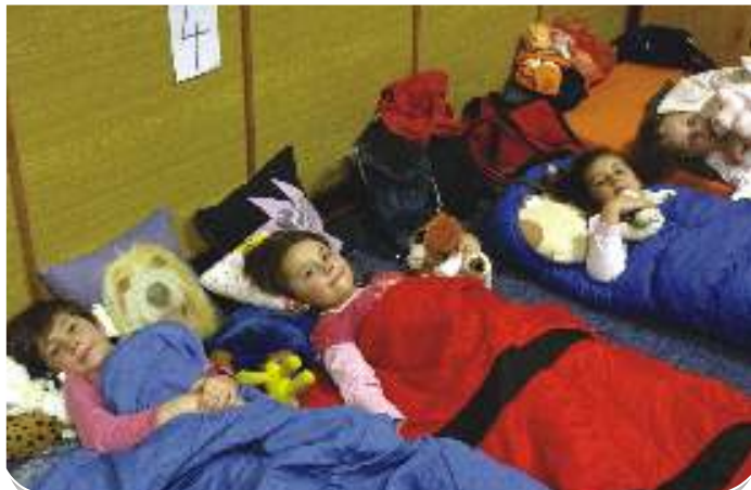
Zážitek jaksepatří - kdo z nás kdy viděl školu po setmění, a dokonce v ní strávil noc?

Učitelé na děti po celou dobu dohlíželi, ale bylo znát, že to neberou jako povinnost: „Mám z toho radost, věřím, že to pro nás všechny bude zážitek - a že se z něj stane tradice.“ (jb)