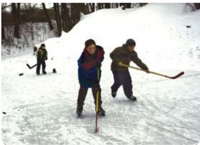
Dětem se mrazivá zima líbila: na rybníku hrály hokej, nebo jen tak bruslily.

co jsme v zimě na chodníky nasypali,“ vysvětluje Václav Dluhoš. „A lidi budou nadávat, že se práší. A pak nás čeká další práce, mezi prvními údržba trávy: pohnojit, vyčistit, pohrabat...“ (jb)