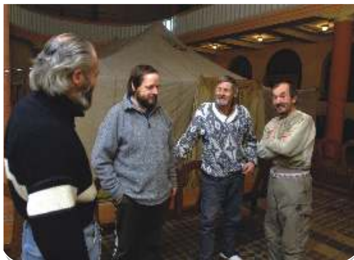
Ostravští bezdomovci nocovali ve stanech starobělských skautů

„Po zkušenostech z loňska, kdy jsme měli v zimě také otevřeno celou noc, jsme již v prosinci zřídili za podpory Magistrátu města Ostravy noční