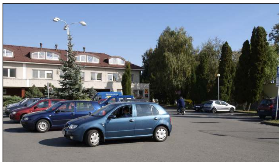
Parkoviště u Hrušky: auta stávají i mimo vyznačená místa, často není jiná možnost.

pozemku za školní družinou, tak aby na něm mohli nechávat zaměstnanci G4S svá osobní auta. „Už je tam odhrnutá zemina, dá se na ni ještě drt