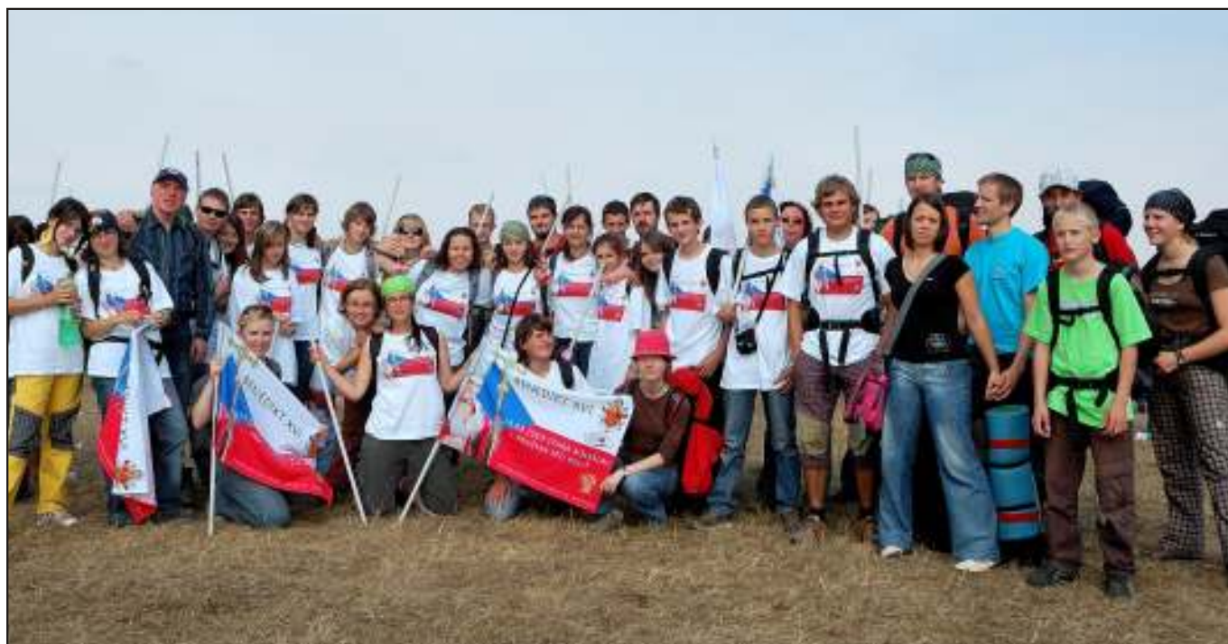
Zdejší mladí katolíci chtěli vidět papeže Benedikta XVI. zblízka. A to se jim také povedlo.

Svatým Otcem i latinsky. Po mši Svatý Otec promlouval k mládeži – ze začátku nás přivítal v češtině a dále pak mluvil italsky. Všechny nás vybízel ke statečnosti a odolávání konzumní společnosti, dával nám za příklad sv. Augustina, který našel štěstí a hodnotný život v Ježíši Kristu