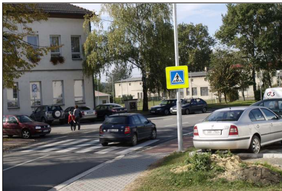
Parkování u jídelny: přestože je stání omezeno na jednu hodinu, jsou auta, která tam stávají celodenně.

níme jina, místa bude dost,“ míní Holář.