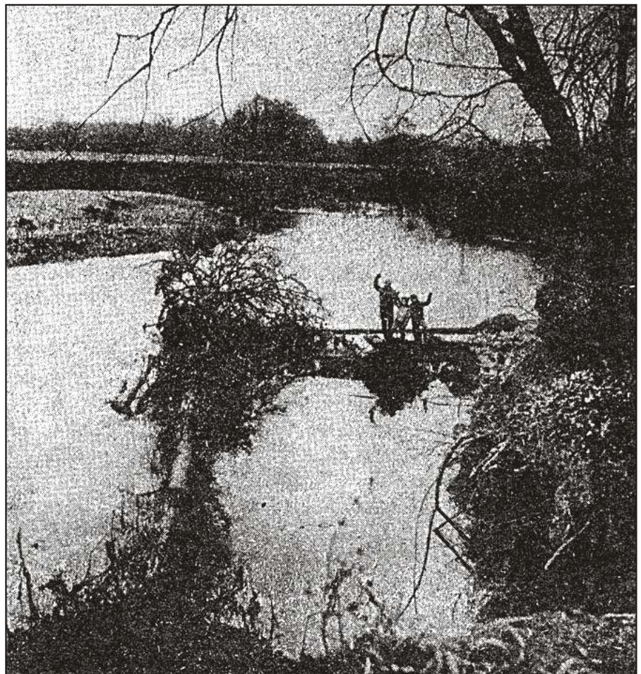
Starobělské děti na dřevěném torzu, které je ponořeno ve vodě