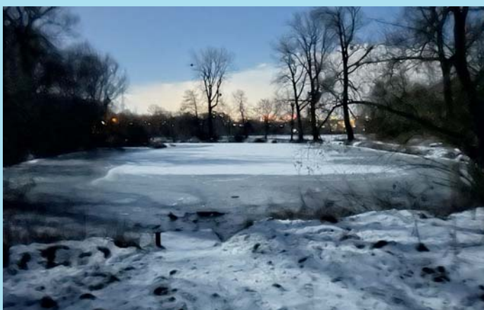
Večerní Poodří.