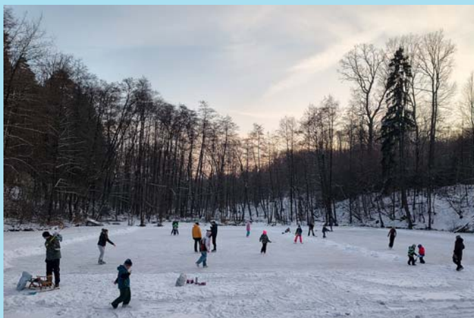
Na rybníku.