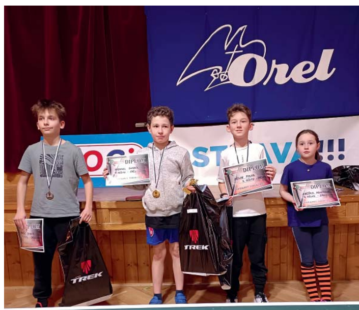
V žákovské soutěži soupeřily kluci i dívky.