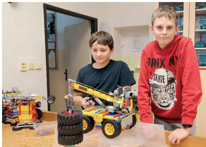
Mladí konstruktéři měli sestavit pohyblivý model jeřábu.