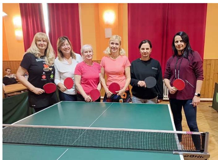
Šestice žen při společném turnajovém nástupu.