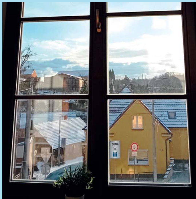
Výhled z Jelena.