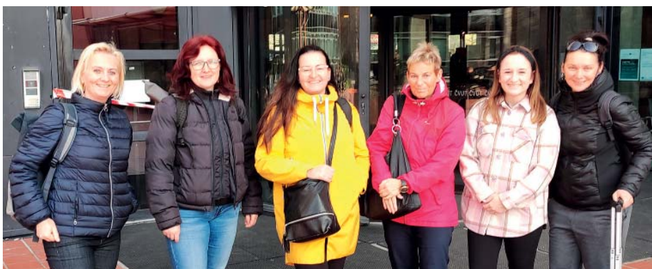
Nová inspirace pro pedagogy. Na celostátní workshop Mensy se vypravilo šest starobělských učitelek.

Tematický den byl inspirovaný soutěží Pohár vědy. Vybraní žáci z 3.-5. tříd zkoumali svět barev, přírodní indikátory, fyzikální vlastnosti papíru a tvořili loga svých týmů. Pět hodin intenzivní práce ukázalo, že je objevování opravdu baví.