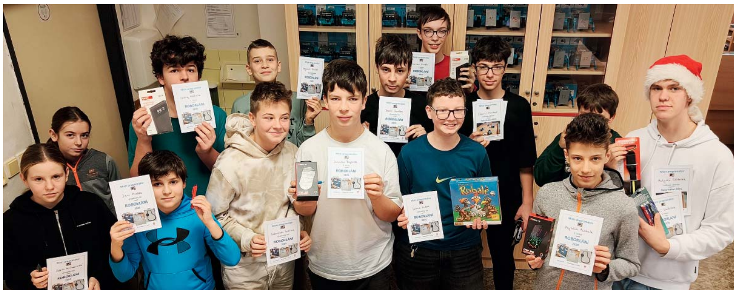
Účastníci Roboklání. Tandemy měřily síly ve třech disciplínách.