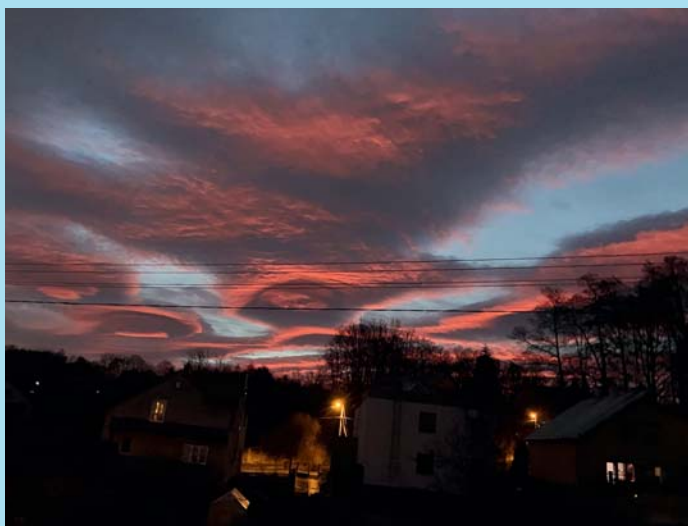
Večerní nebe.