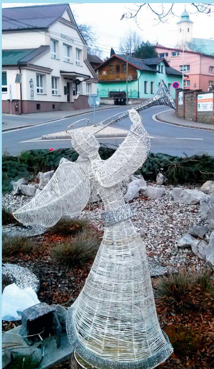
Anděl na rynku.