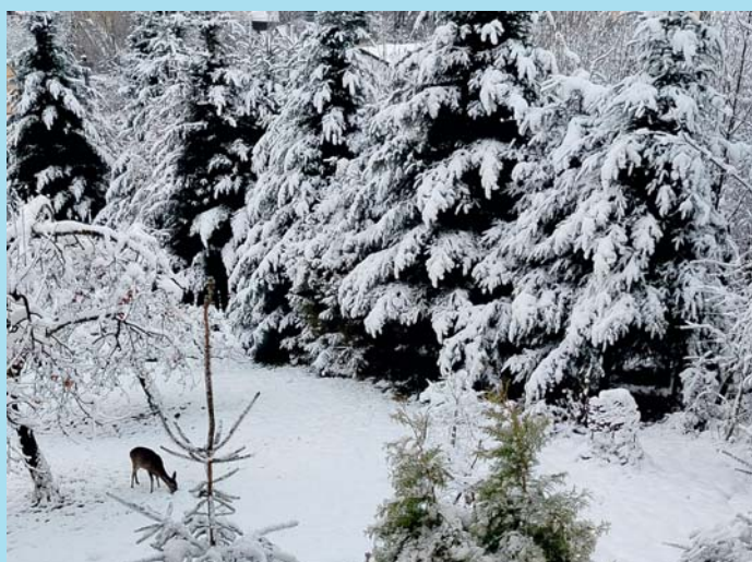
Na sněhu.