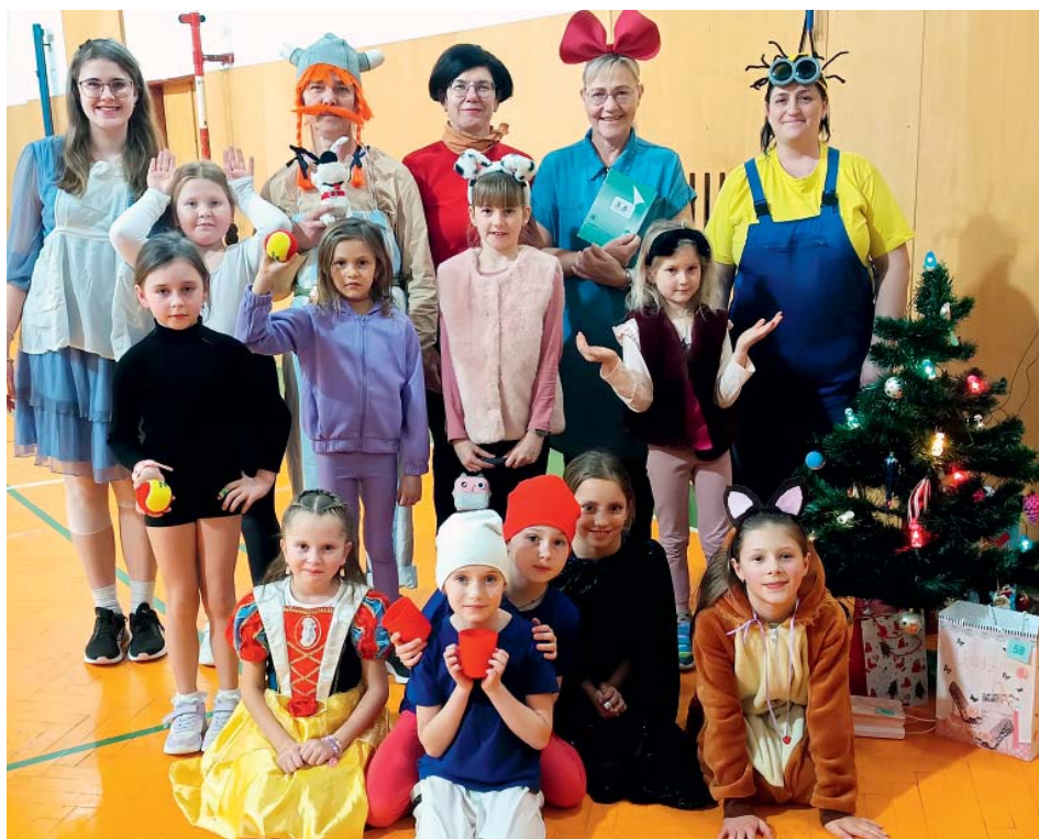
Za pohádkové postavy se oblékly žačky i cvičitelky.