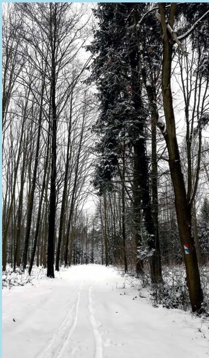
Bílo v Palesku.