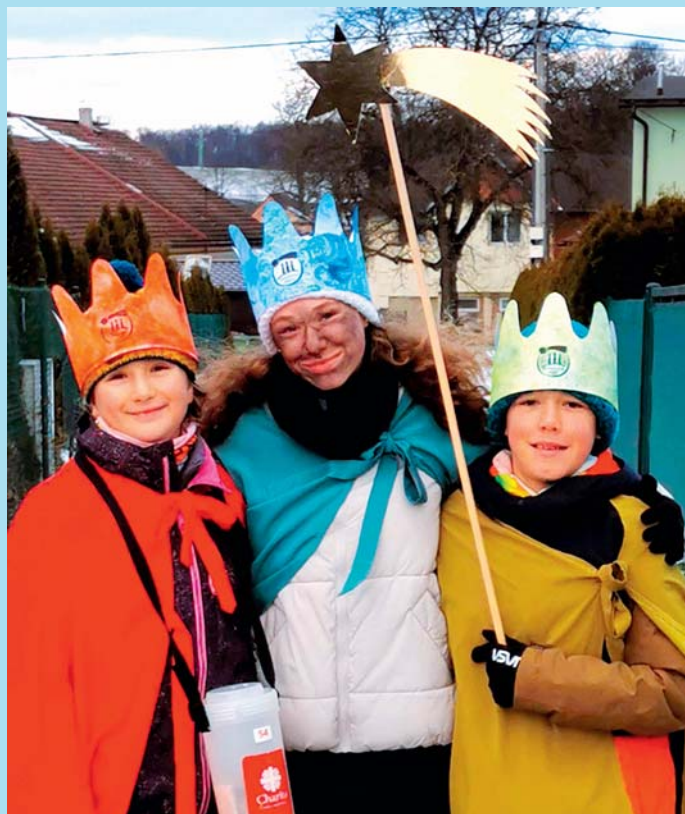
Tříkráloví koledníci.