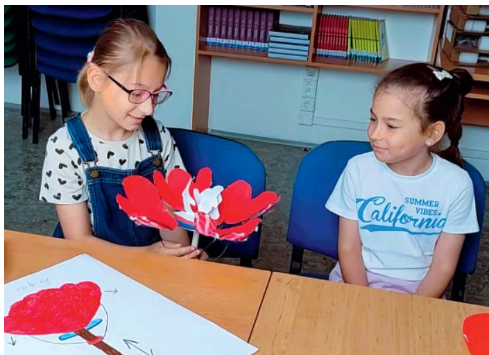
Nápady, modely a vynálezy museli autoři taky obhájit před porotou.