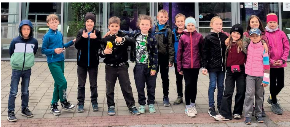
Astronomie na vlastní oči. Několik dětí navštívilo planetárium.

Do soutěže Objevu roku přihlásilo nápady, modely a vynálezy rekordních 21 týmů prvního stupně. Děti prokázaly tvořivost, odvahu prezentovat a schopnost odpovídat na otázky poroty. Výsledky šly na výstavku do respiria pavilonu A.