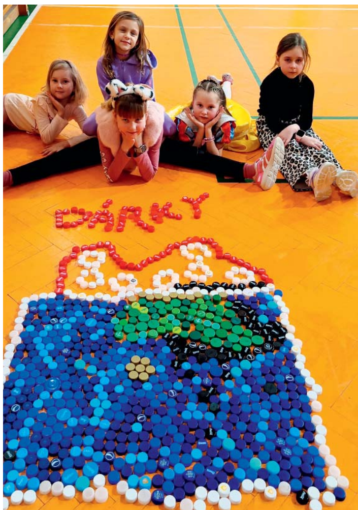
Nápisy a obrázky z plastových víček. Společné tvoření holky bavilo.