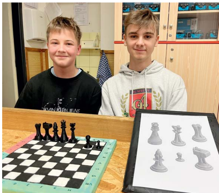
Navrhnout figurky a šachovnici. Úkol pro účastníky soutěže v 3D modelování.