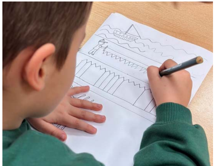
Vlnky i čáry. Cílem je rozpoznat schopnost práce s tužkou.