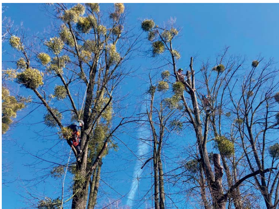
Arboristé v koruně. Zatím odstranili jmelí na asi 170 stromech.