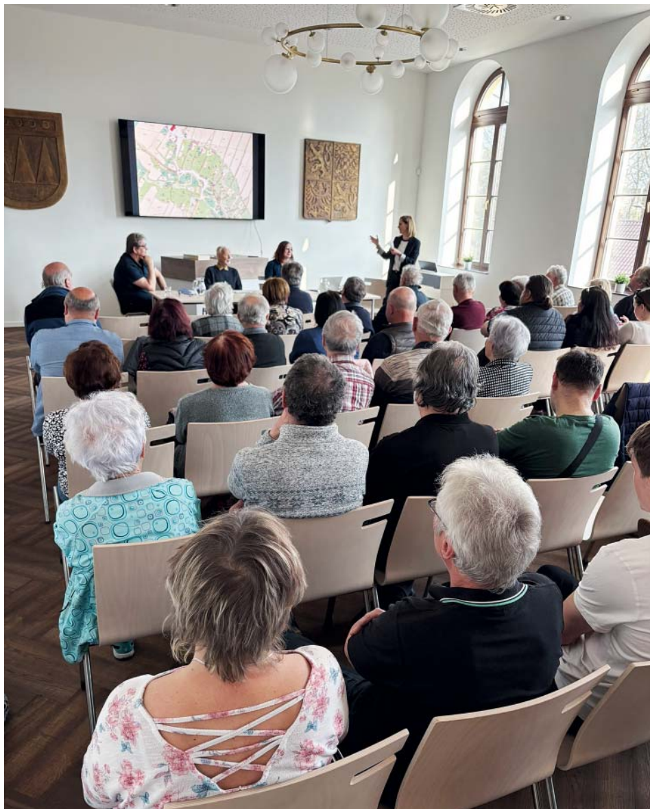
Osudy lidí, kteří v domě kdysi pobývali. Poslechli si je ti, kdo v obci žijí dnes.

1937 Další úprava. Namísto společenského sálu se v prostředním patře dalo bydlet.