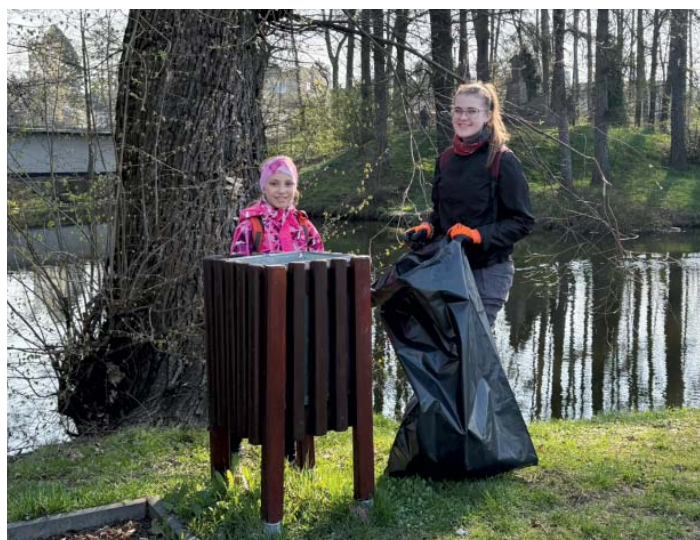
Žačky ze Sokola a úklid v okolí rybníka Na Zámčiskách.