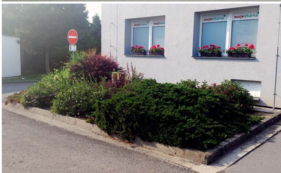
Současný stav. Zeleň je přestárálá a čeká ji výměna.