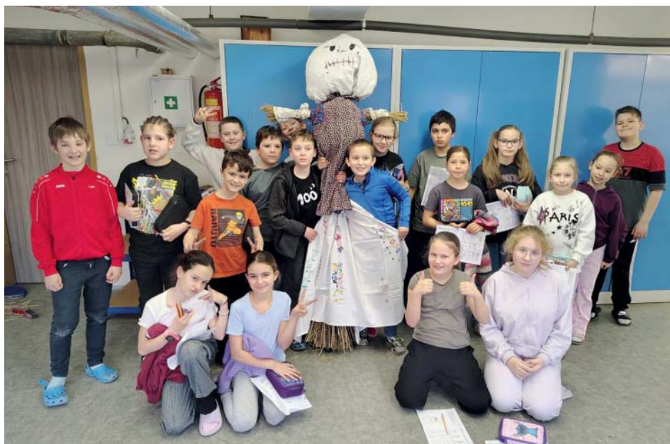
S hotovou figurínou. Výroba žákům 4. A trvala dvě hodiny.

Děti se rozdělily na týmy. Každý dvě hodiny pracoval na jednotlivých částech Morany. Někdo tvořil tělo, někdo zdobil sukni, jiní navazovali oblečení nebo malovali obličej. Současně žáci vyplňovali pracovní list, aby se o Moraně dozvěděli více.