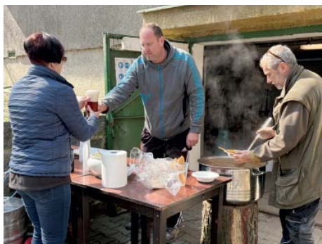
Myslivci sklízeli chválu za připravený guláš.