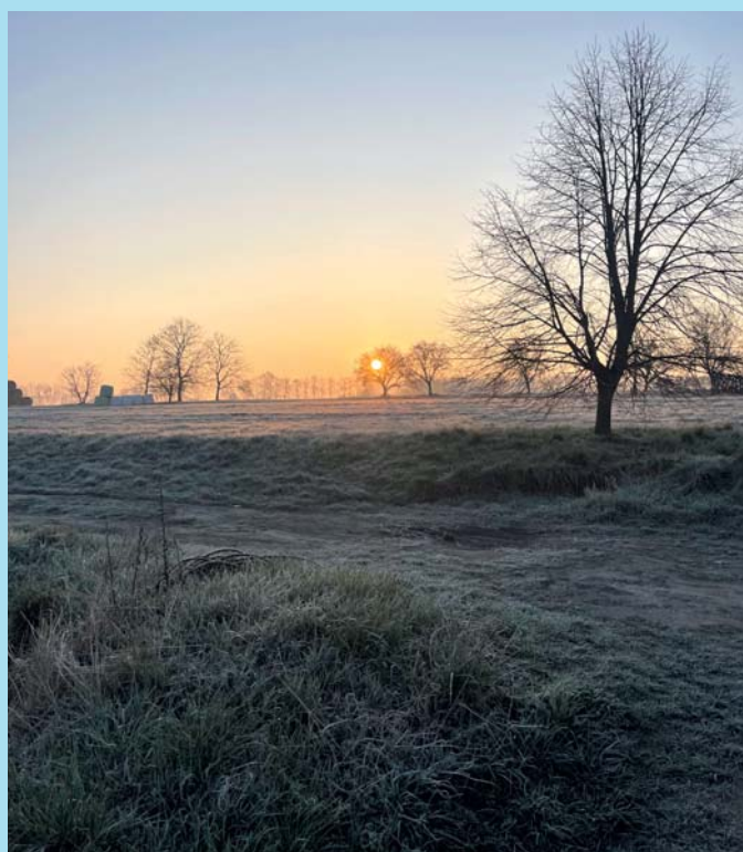
Poslední ranní mrazík.