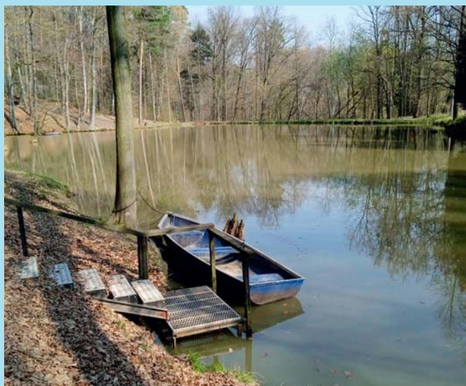
U rybníka.