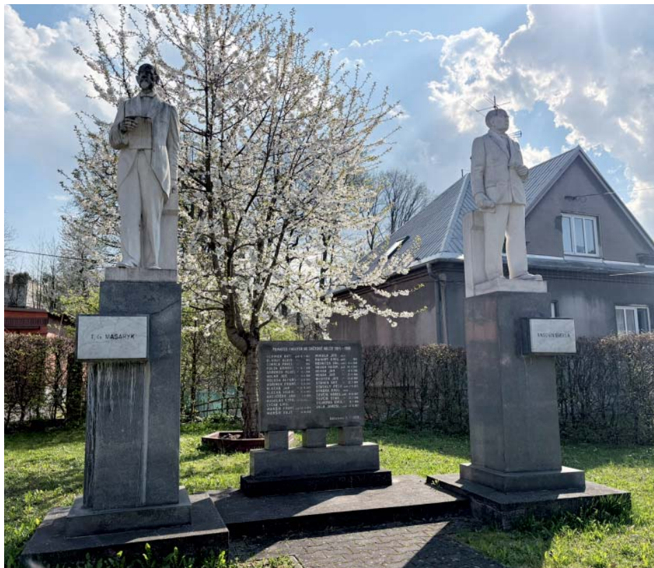
Trojice pomníků stojí v Mitrovické ulici na horním konci.

Bylo to velkolepé. Vše začalo už v předvečer, 4. července, koncertem na náměstí. Hudba zněla i v den odhalení. Účastnil se ho mimo jiné tehdejší předseda Poslanecké sněmovny a bývalý premiér Jan Malypetr. Zhruba v jednu hodinu odpoledne se na dolním konci obce, U Matěje, shromáždil průvod, který prošel obcí.