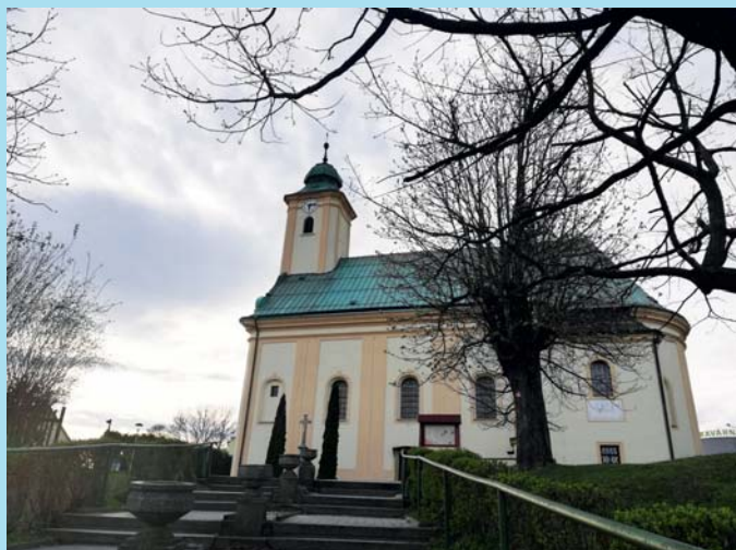
Velikonoční sobota.