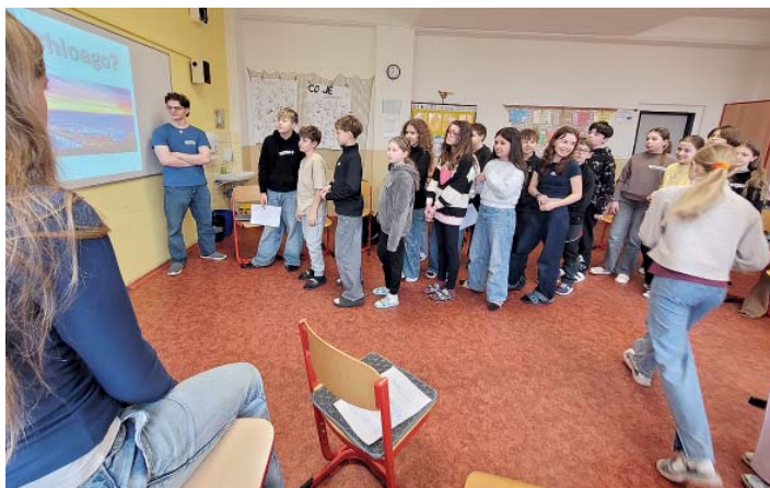
Hravě a srozumitelně. Školáci získali informace o městě Chicago.