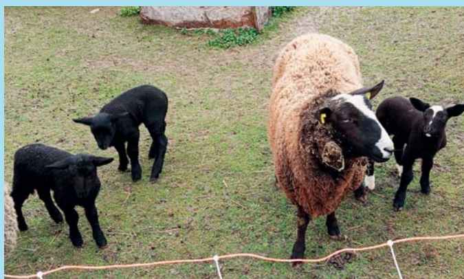
Sousedovic jehňátka.