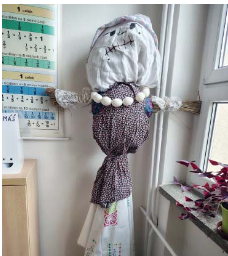
Moranu čtvrťáci oblékli a nezapomněli ani na náhrdelník z vajec.

Čtvrťáci starobělské základní školy se letos se zimou rozloučili v duchu starých lidových tradic – pustili se do výroby Morany. Nejprve pro inspiraci zhlédli pohádku Jak se Andulka bála smrtky z cyklu Chaloupka na vršku. Pak se šlo do dílen základní školy.