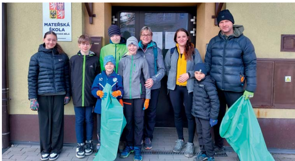
Zapojili se taky dospělí s dětmi ze starobělské školy a školky.