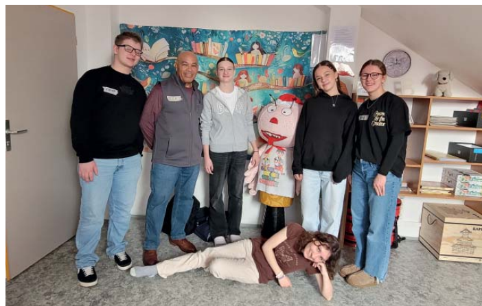
Američany doprovázely žákyně 9. tříd, zkusily si i roli tlumočnic.