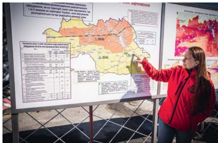
U mapy černobylské zóny.

Pochází z Mostecka, vystudovala zahraniční obchod a cestovní ruch. K fyzice, chemii i technice prý ale odjakživa tíhla - ráda zjišťuje, na jakých principech věci fungují. „Když bouchl Černobyl, byla jsem devítileté dítě, kterému maminka řekla, že se něco stalo. Chtěla jsem to vidět. A pořád jsem nerozuměla, jak to může být neviditelné. Že radiace je nebezpečná, ale vidět není,“ vzpomíná na své jaro 1986.