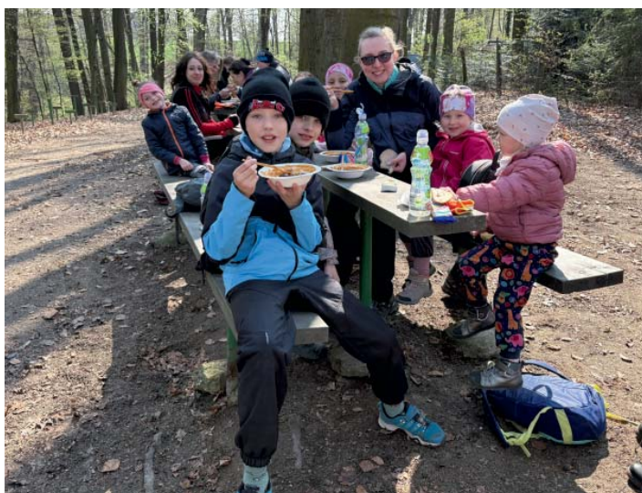
Zasloužená odměna. Sokolská skupina si vychutnávala oběd.