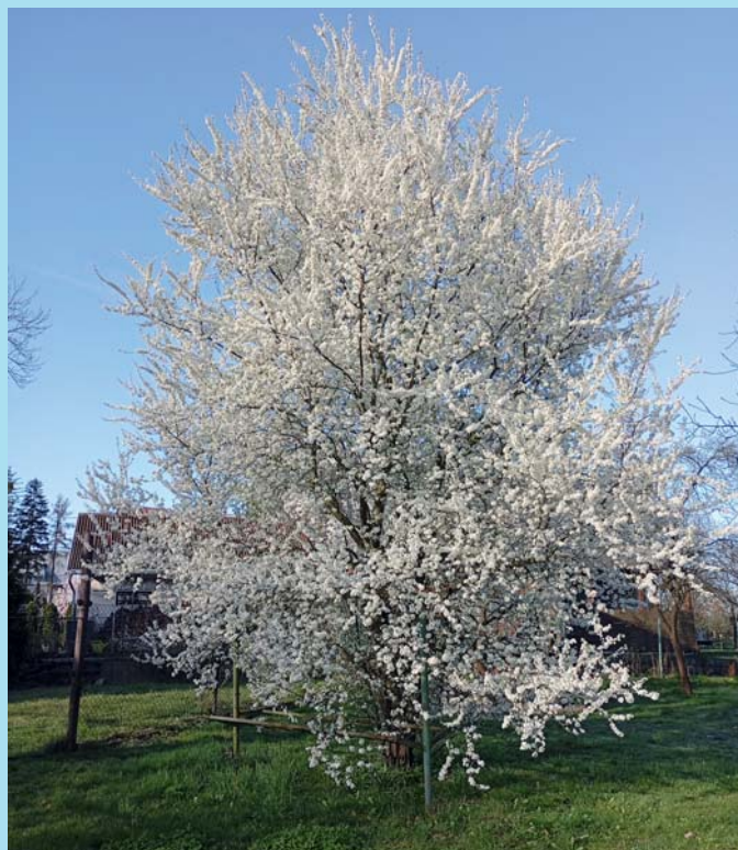
Bílé Velikonoce.