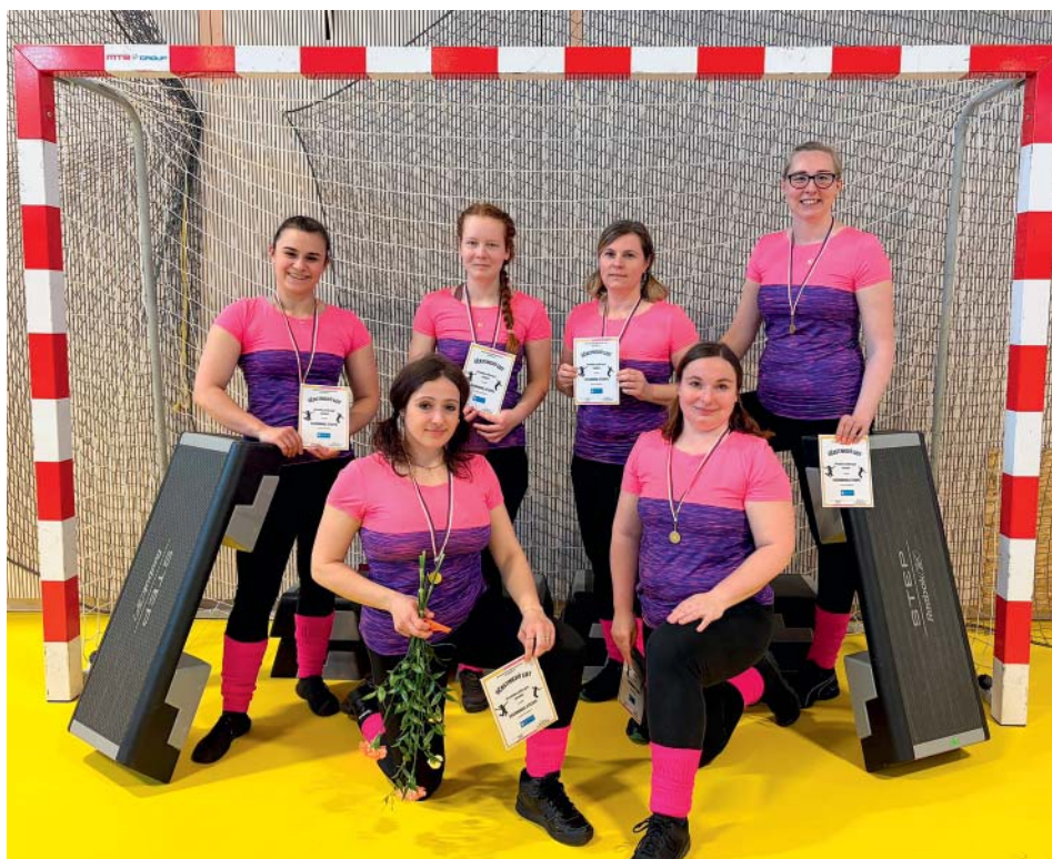
Šestice cvičenek ze Staré a Nové Bělé společně s úspěchem předvedla své vystoupení na stepch.