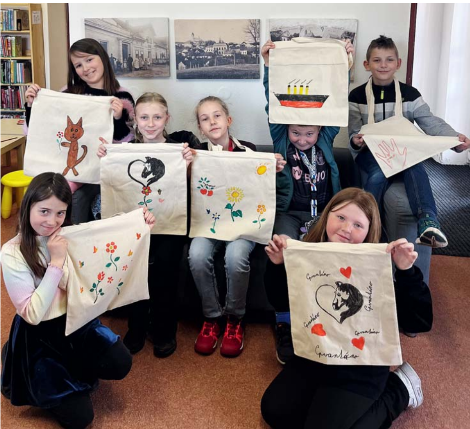
Vlastnoručně vyzdobené tašky. Inspirace? Planeta Země.