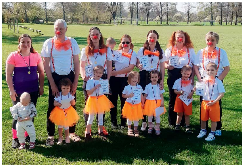
Rodiče s dětmi trénovali dva měsíce. Doprovodnou píseň si velmi oblíbili.

Skladba Drumming Steppes vznikla již v roce 2013 při příležitosti akademie k výročí TJ Sokol Stará Bělá a tehdy znamenala velký úspěch. Její autorka