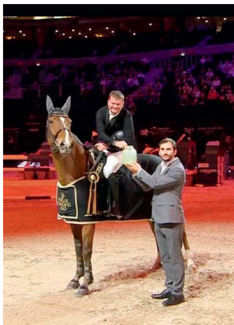
Vítězství v jedné ze soutěží Prague Play-offs v listopadu 2025.