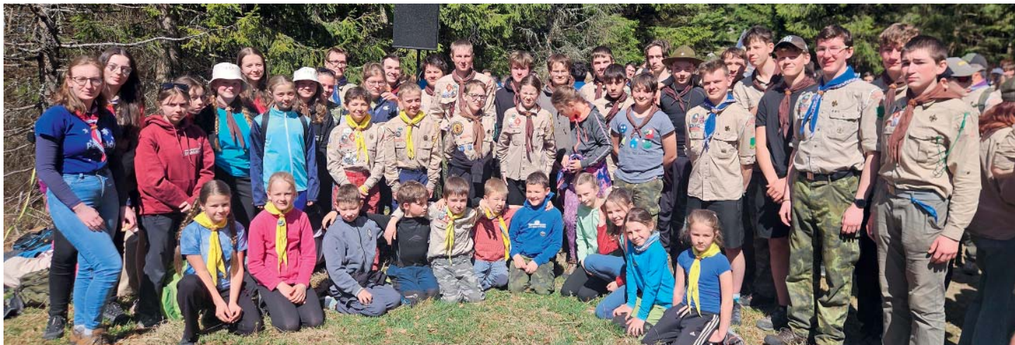
Starobělské oddíly při společném skautském setkání.