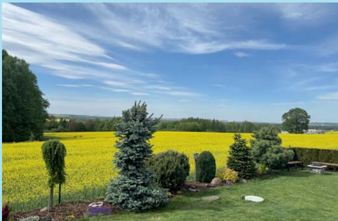
Čekání na dešť.