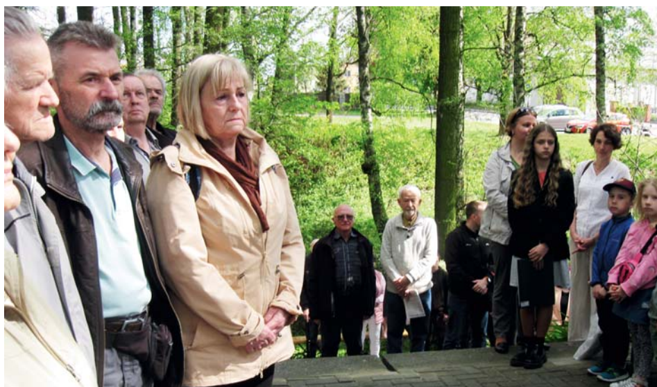
Prvomájová pieta u památníku obětem 2. světové války.