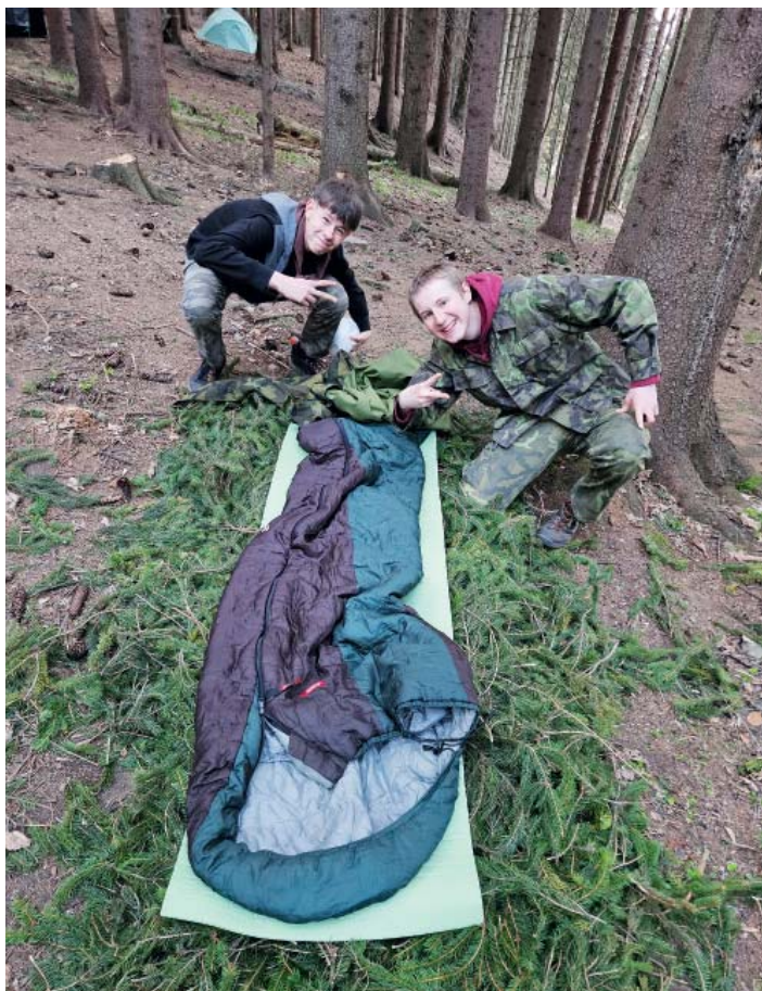
Někteří skauti pod Ivančenou přenocovali.