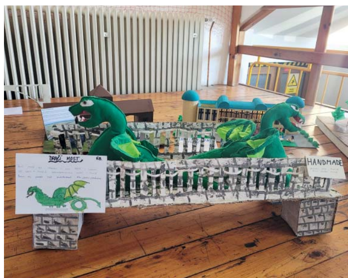
Dračí most ve slovinské Lublani. Originálně pojatý model šestáků.