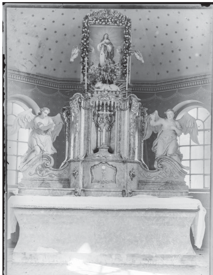
Poklady z fotoarchivu: starobělský oltář byl v letech 1900–1940 dočasně ve výškovické kapli.

S myšlenkou postavit pomník Švehlovi přišli místní agrárníci již v roce 1934 a chtěli jej postavit vlastním nákladem. Požádali obecní zastupitelstvo o pronájem pozemku. To vyvolalo další návrhy, nakonec se zástupci stran a spolků zcela demokratickým způsobem dohodli a 5. července 1936 došlo ke slavnostnímu odhalení soch a pamětní desky. Zároveň se slavností byl vyhlášen i den brannosti. Obojí jasně definovalo vztah našich předků ke svobodné vlasti.