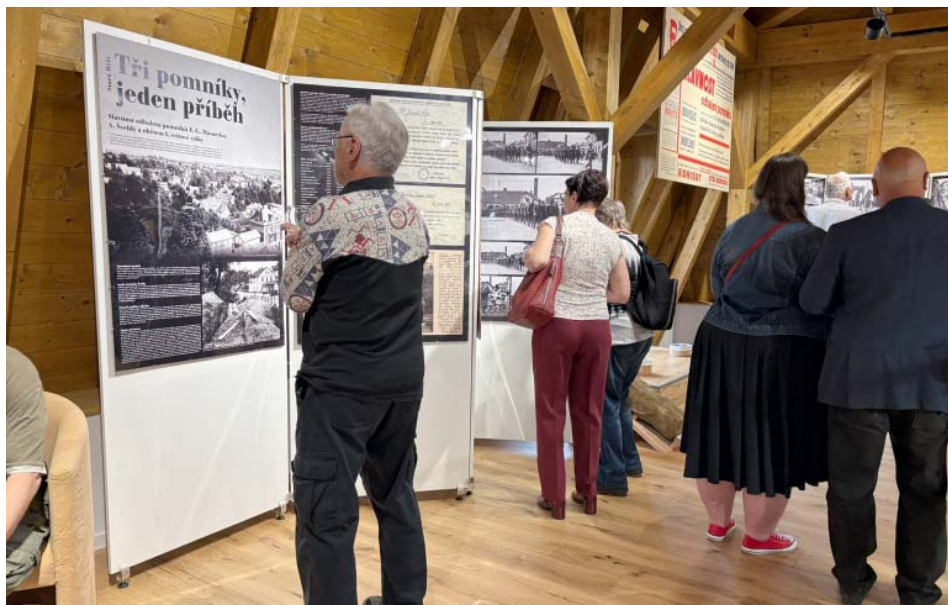
Vernisáž navštívily na tři desítky Starobělanů.

7. května ji zahájila vernisáž, na kterou se přišly podívat asi tři desítky návštěvníků.