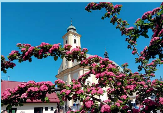
Májová momentka.