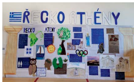
středkovali informace o Řecku.