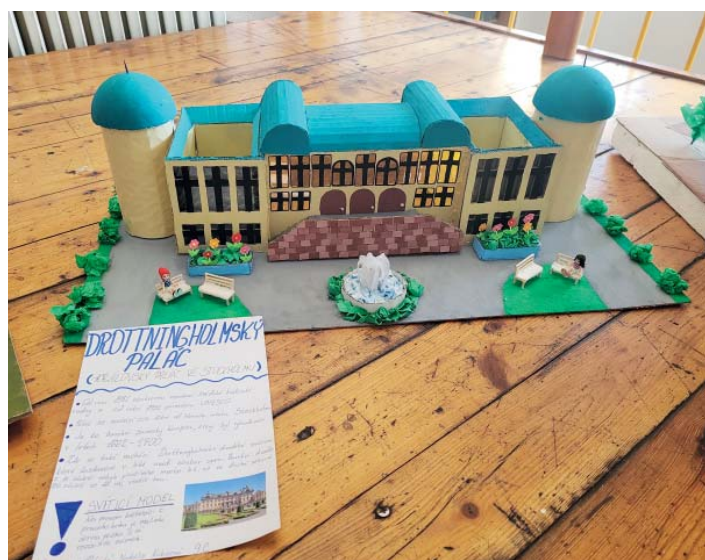
Královský palác ve Stockholmu - vítězný model Dnů Evropy.