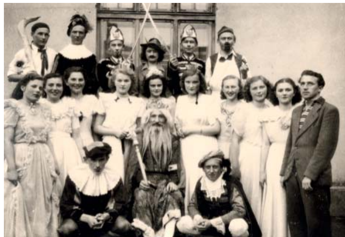
Orelský archiv: divadelní představení Neohrožený Mikeš.