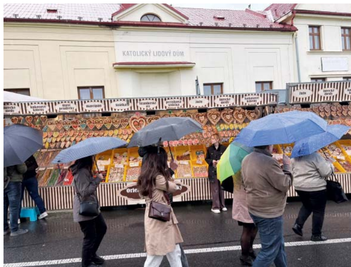
Bez deštníků se letošní pouť neobešla.