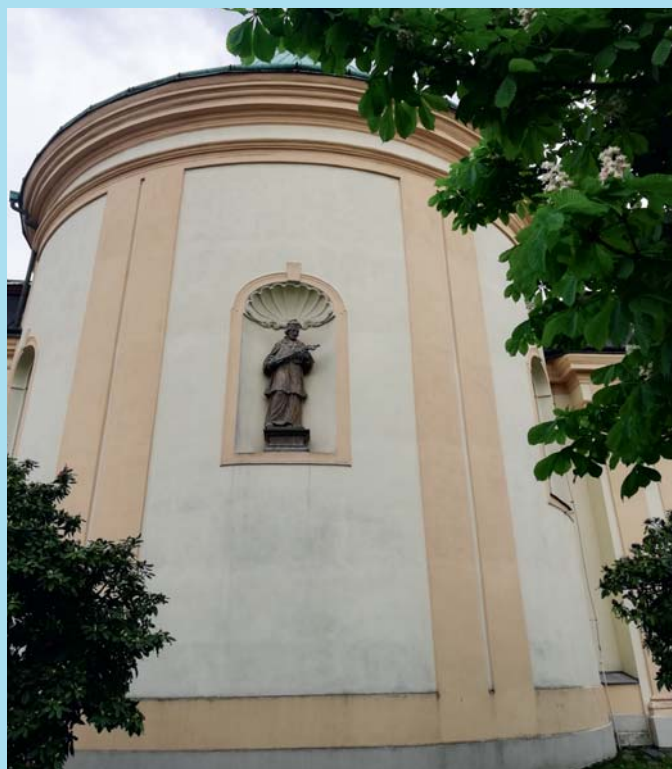
Svatý Jan Nepomucký.