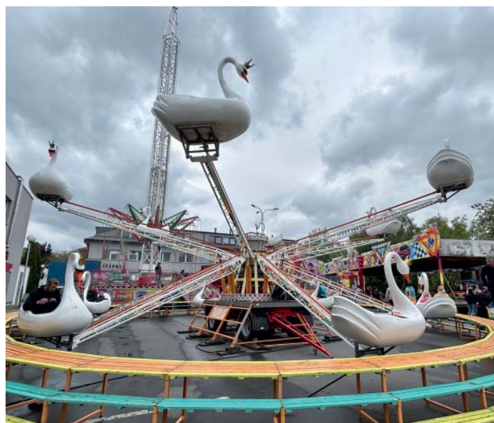
Nekryté kolotoče byly odkázány na chvíle, kdy nepršelo.

Oba muži tak odkázali k faktu, že tradice Starobělské pouti by bez místního kostela nevznikla. Její počátky totiž navazují na samotné vysvěcení kostela, které se odehrálo v roce 1801. Sami farníci ale vnímají širší význam pouťového víkendu. I pro ně je pouť taky o radosti z setkávání sousedů a známých – nejen v kostele, ale i mezi stánky a kolotoči.