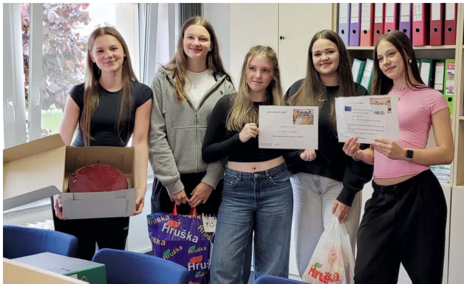
Tým vítězné 9.C získal krom jiného i poukaz na edukační vycházku.

Na tři vítězné kolektivy čekal při závěrečném vyhodnocení nejen diplom, ale i poukaz na jeden den bez výuky, který bude mít formu edukační vycházky. Příspěvek Sdružení rodičů a přátel školy