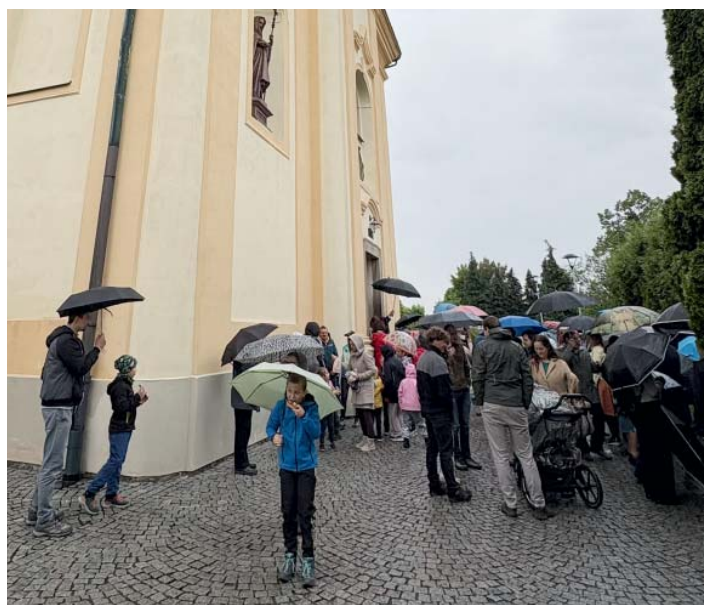
Farníci před kostelem po nedělní dopolední mši.