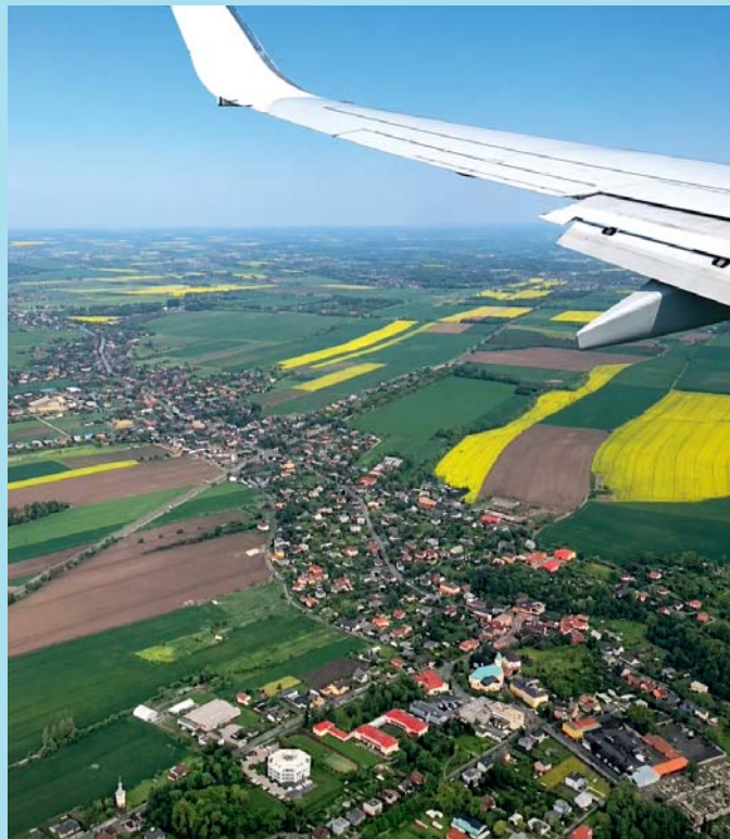
Ta naše vesnička.