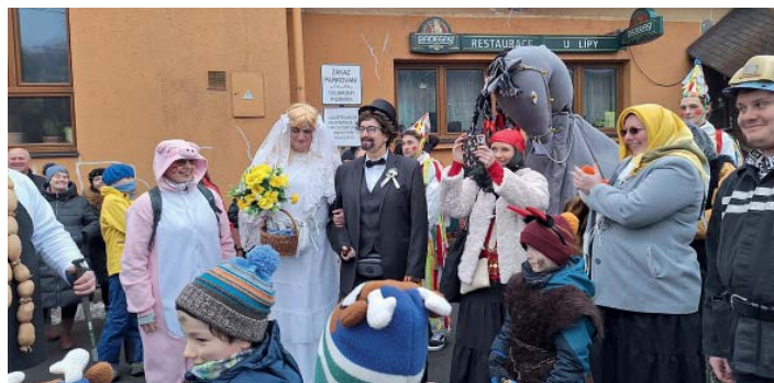
Další fotky na https://starobelaci.rajce.idnes.cz .