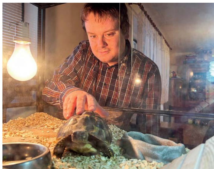
I želva dostala jméno po jedné z místních šachet: Žofie.