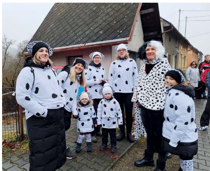
K masopustnímu průvodu se připojilo na 80 maškar. Včetně početné rodiny dalmatinů.