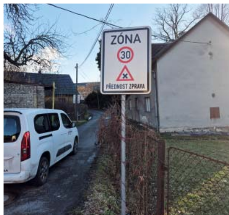
Zóna s jasně danými pravidly.

Po sešlápnutí brzdy pokračuje auto při třicítce dalších asi 13 metrů, při padesát-