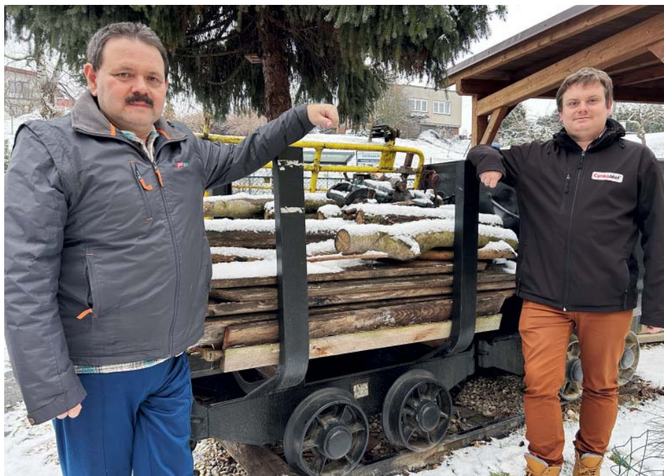
Důlní vozík jako zahradní artefakt.

Pro něj samotného dál zůstává haviřína na koníčkem. Archivní materiály, výbava horníků, vzpomínky, opuštěné šachty. To