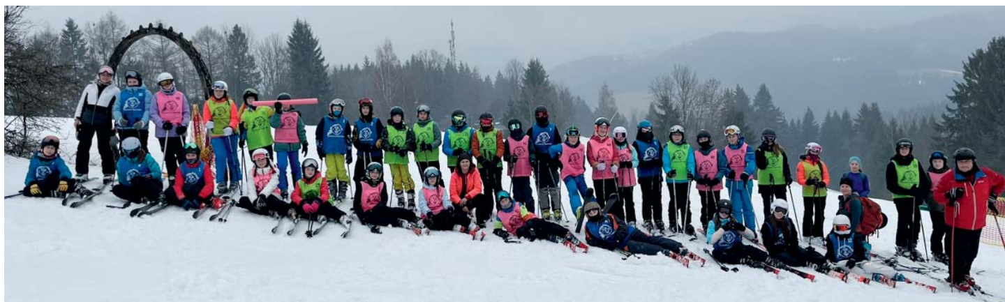
Lyžařský výcvik ve Velkých Karlovicích. S programem na svahu i mimo něj pomáhali studenti tělocviku Ostravské univerzity.