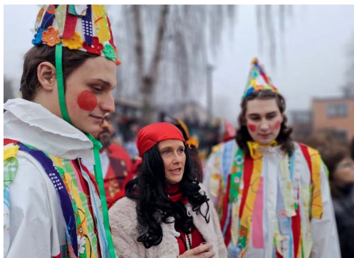
Svobodní mládenci jako Strakatí. O dalším osudu jim cestou v průvodu věštila cikánka z karet.