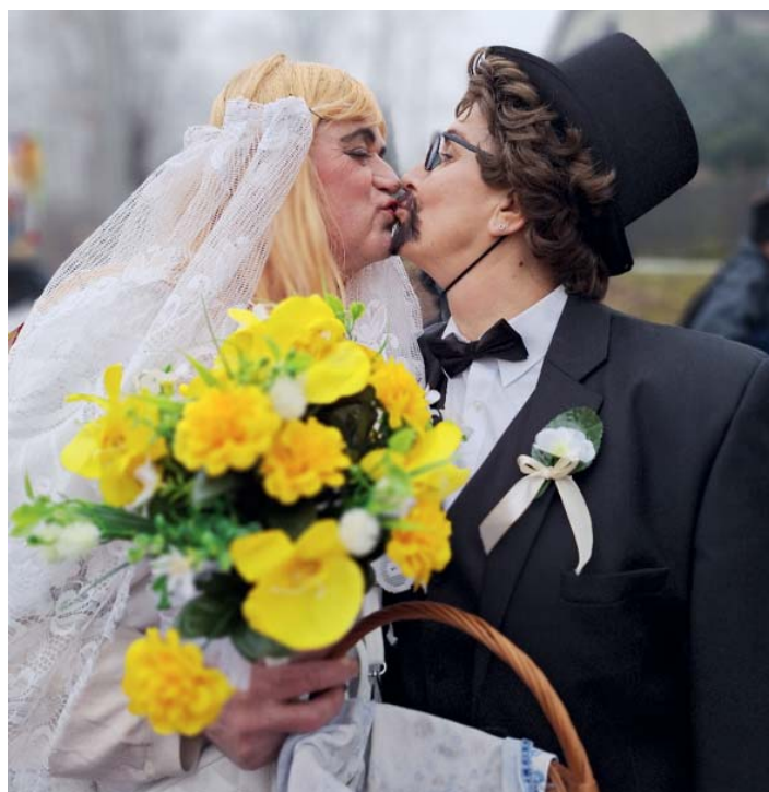
Bez nevěsty a ženicha byl to nebyl masopust. A oni jsou to opravdu manželé i v reálu. Akorát obráceně.