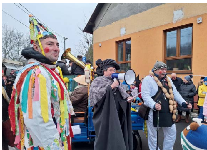
Než průvod vyšel, zažádal Laufr o udělení masopustního práva. Starosta masopustní veselí rád povolil, a tak se všichni mohli radostně vydat na obchůzku obcí.