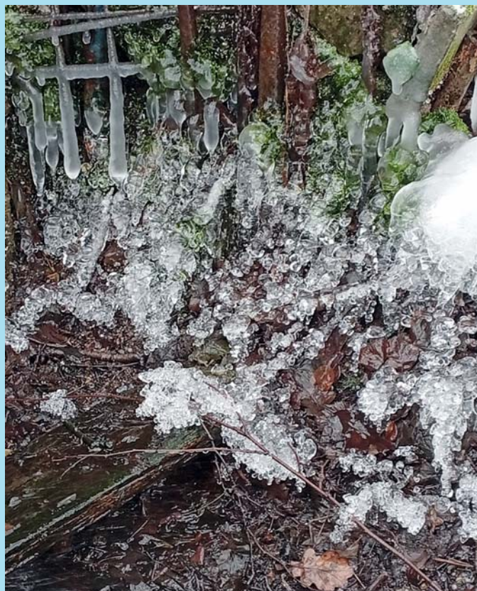
Zimní čarování.