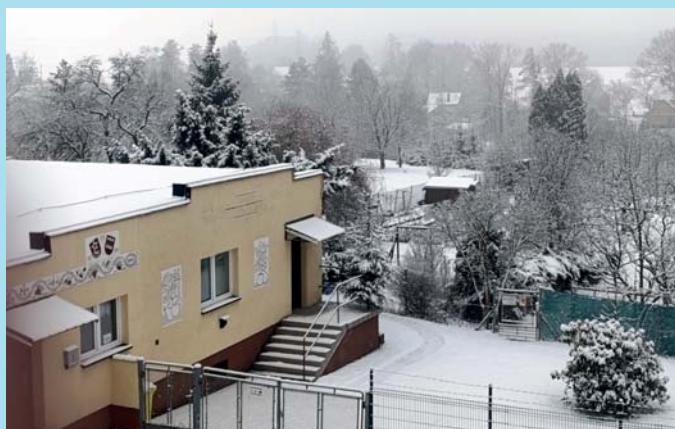
Zahrádky v peřině.