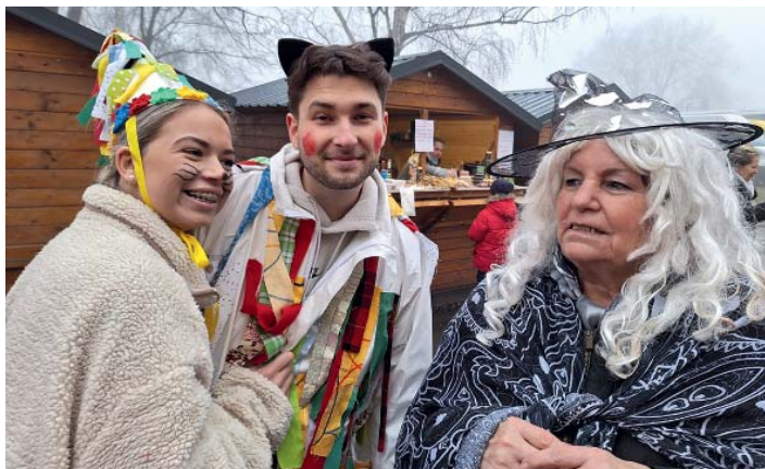
Rodinná setkání v cíli průvodu. Vzájemná výměna pokrývek hlavy.