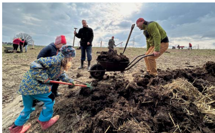
Společně. To je princip, který se osvědčil.