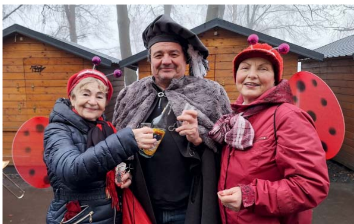
Ke Starobělanům se připojili i přespolní. V tomto případě dámy z Hrabůvky.