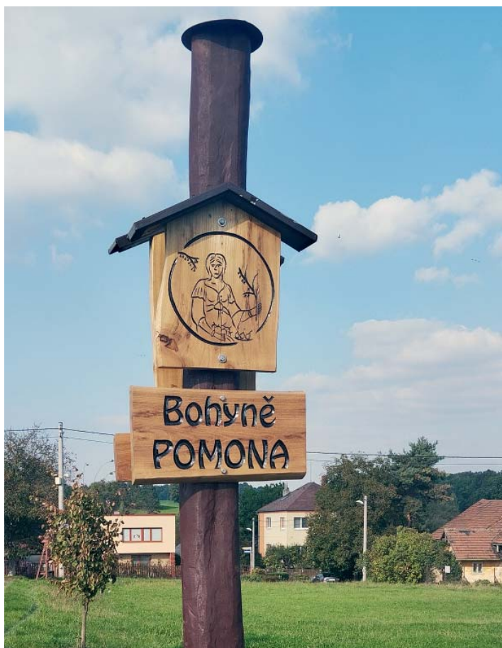
Jeden z označnicků odkazuje k bohyni ovocnářství.

Osevu navzdory, jako první svou šanci využily jednoleté plevele. Pomohl i dostatek srážek na konci jara a začátku léta. Rostliny vytrvalých trav a jetele nemají v prvních měsících takovou sílu, s každou další sečí se ale podíl plevelů snižuje. Úvodní rok je tedy jednoznačně nejnáročnější.